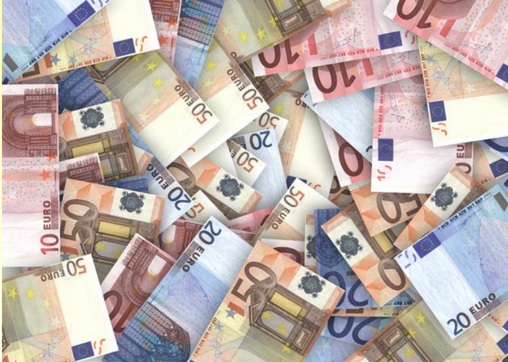
Gerd Altmann / pixelio